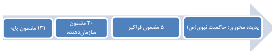
شکل ۳. سیر تطور عبارات‌های علامت‌گذاری شده تا ظهور پدیده «حاکمیت نبوی»

مرحله کدگذاری و شناخت مضامین به تشکیل ۱۳۱ مضمون پایه منجر شد که به ۳۰ مضمون سازمان‌دهنده ارجاع دارند. سپس از تلفیق مضامین سازمان‌دهنده ۳۰ گانه، ۵ مضمون فراگیر (اخوت و یگانگی، یکپارچگی، پاداش الهی، حاکمیت خدا و پیامبر (ص)، و همیاری) پدید آمد که به لحاظ معنایی و ساختاری به ترتیب با وجوه ۵ گانه حاکمیت شامل پایه مناسبات، میزان وابستگی، واسطه مبادله، وسیله حل تعارض و هماهنگی، و فرهنگ همخوانی دارند. این فرایند چند مرحله‌ای تحلیل داده‌ها از عبارات‌های مندرج در متن تا ظهور پدیده محوری «حاکمیت نبوی» در شکل شماره ۳ نشان داده شده است.