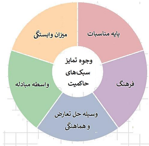
شکل ۱. چارچوب نظری پژوهش برای شناسایی و تمایز سبک‌های حاکمیت