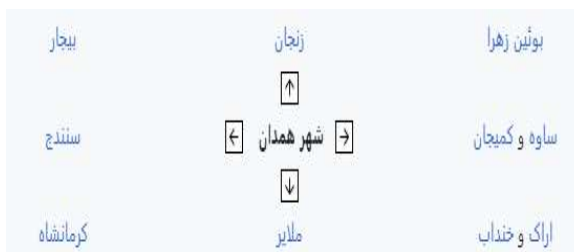
شکل (۱): موقعیت شهر همدان

اما امروزه به دلیل تراکم جمعیت و طرح شعاعی، ترافیک مرکز شهر بسیار زیاد است. به این میدان ۶ خیابان اصلی شهر وصل شده‌اند. مساحت این شهر ۶۲۸۵ کیلومتر مربع است [۴]. و در طول و عرض جغرافیایی 34^{\circ} 8' 0'' شمالی 48^{\circ} 52' 0'' شرقی واقع شده است [۱۱]. در شکل (۱) موقعیت شهر همدان نسبت به شهرهای اطراف نشان داده شده است.