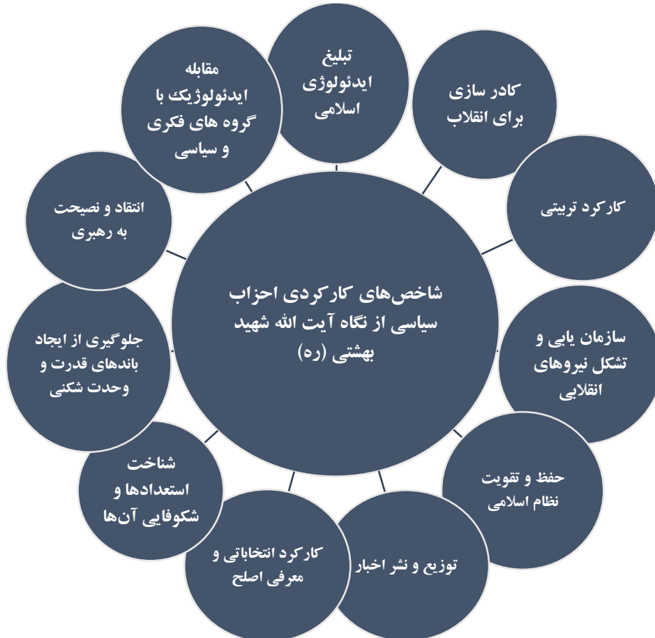
نمودار شماره ۵: شاخص‌های کارکردی احزاب سیاسی از نگاه شهید بهشتی (ره)