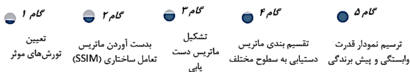
شکل ۱. مراحل مدل سازی تفسیری ساختاری