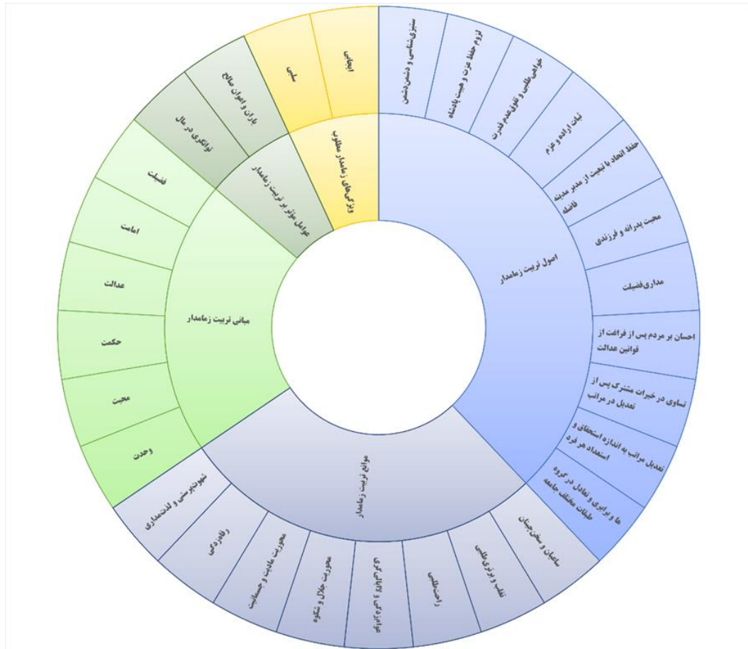
نمودار ۱. الگوی تربیت زمامدار در اندیشه خواجه نصیرالدین

در مقام جمع‌بندی اندیشه خواجه نصیرالدین می‌توان گفت الگوی تربیت زمامدار در اندیشه وی بر پنج رکن استوار است: فضیلت، امامت، حکمت، عدالت و محبت. فضیلت را می‌توان محور سه رکن حکمت، عدالت و محبت در نظر گرفت. به عبارت دیگر تربیت زمامدار در نگاه او