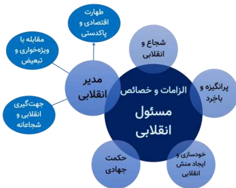
نمودار ۵. الزامات و خصایص مسئول انقلابی در گام دوم انقلاب