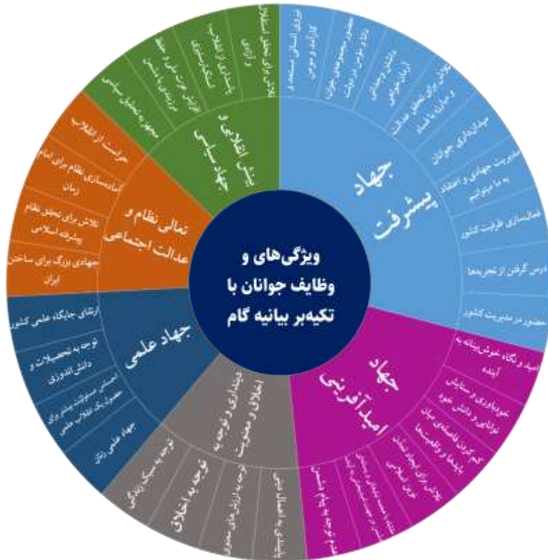
نمودار ۸ وظایف محوری جوانان در گام دوم انقلاب