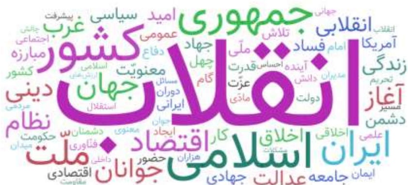
نمودار ۲. ابر کلمات پرتکرار بیانیه

برای اینکه بدانیم محتوای اصلی بیانیه در چه زمینه‌ای شکل گرفته می‌توان از ابر کلمات متن اصلی بیانیه بهره گرفت. استفاده از ابر کلمه می‌تواند نشان دهد که کلمات معنادار اصلی متن بیانیه چه عباراتی هستند. در ایجاد ابر کلمه از نرم‌افزار Orange Data Mining بهره گرفته شد و متن بیانیه در نرم‌افزار قرار گرفت تا ابر کلمه تشکیل گردد. لازم به ذکر است که کلمات اضافه و علامات نگارشی در ابر کلمه در نظر نگرفته شده است.