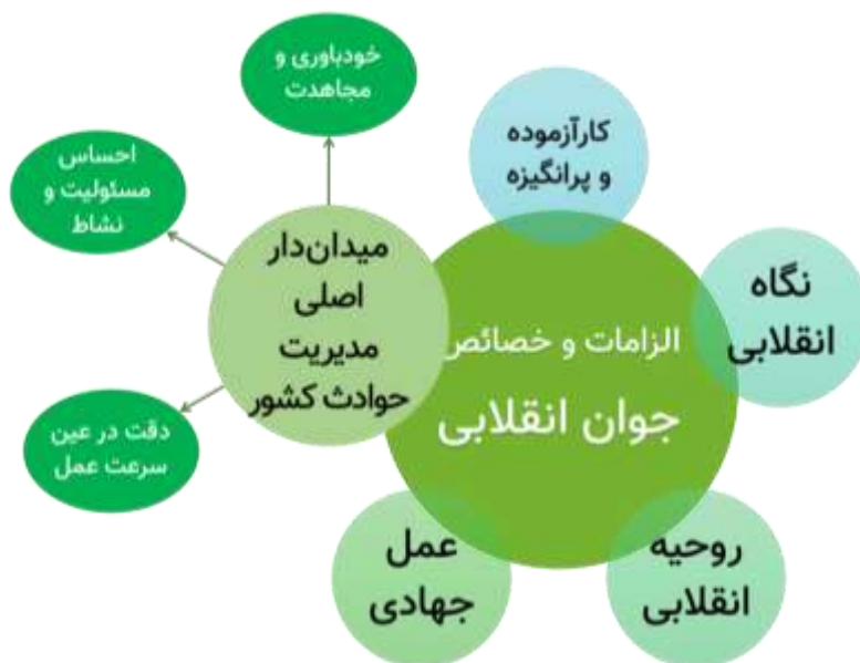
نمودار ۷. الزامات و خصائص جوان انقلابی در گام دوم انقلاب

«جوان انقلابی کارآزموده و پرانگیزه است؛ نگاه و روحیه انقلابی دارد و با عمل جهادی در حوادث و مسائل کشور میدان‌دار و در مرکزیت قرار دارد؛ لازمه عمل جوان انقلابی در حوادث کشور داشتن روحیه خودباوری و مجاهدت، احساس مسئولیت و نشاط و درعین حال دقت در عین عمل سریع است که در بیانه به‌درستی تصریح شده است.»