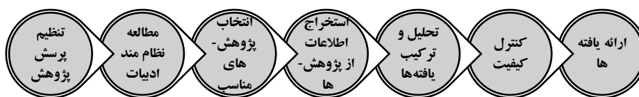
شکل ۱. گام‌های سنتزپژوهی در پژوهش حاضر (ساندولوسکی و باروسو، ۲۰۰۶)

این پژوهش از نظر هدف کاربردی و توسعه‌ای است. رویکرد به کار گرفته شده کیفی و از نوع سنتزپژوهی است. راهبرد مورد استفاده، فراترکیب است که با انجام تحلیل محتوای استقرایی و سپس فراترکیب از تحلیل‌های انجام شده همراه است. بنابراین رویکرد پژوهش، کیفی و روش آن، سنتزپژوهی می‌باشد. سنتزپژوهی، ترکیب ویژگی‌های خاص ادبیات پژوهش به صورت کلی است. هدف سنتزپژوهی، ترکیب پژوهش‌های تجربی به منظور ایجاد تعمیم‌ها است (کوپر و هجز ۱ ، ۲۰۰۹). برای اجرای روش سنتزپژوهی در پژوهش حاضر از روش هفت مرحله‌ای (ساندولوسکی و باروسو ۲ ، ۲۰۰۶) مطابق شکل ۱ استفاده شد که در ادامه توضیحاتی در خصوص هر مرحله ارائه شده است.