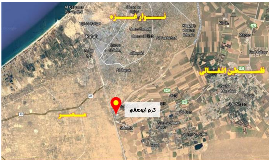
شکل ۱: گذرگاه مرزی ابوسالم

هرچند حماس در این اقدام، ناگزیر به مبارزه رو در رو با ارتش رژیم صهیونیستی بود، اما مسیر تونل و همچنین تلفات برجای مانده از این حمله، هیچ گونه آسیبی را متوجه غیرنظامیان سرزمین‌های اشغالی نکرد. حتی از سال ۲۰۱۴ که درگیری‌های حماس و رژیم صهیونیستی رسماً شدت گرفت، تونل‌های فرامرزی حماس با وجود نزدیکی نسبی و گریزناپذیر به محدود جمعیت غیرنظامی، تاکنون کوچک‌ترین آسیبی را متوجه آنان نساخته است. حماس در این میان، از شبکه‌های زیرزمینی مستحکم و پیچیده‌ای به عمق ۲۰ متر و به طول بیش از ۱,۵ کیلومتر در میان مناطق خان‌یونس ۱ در غزه و عین هشلوشا ۲ مطابق شکل ۲ در فلسطین اشغالی استفاده کرد که شامل چندین مسیر ورودی و خروجی و شفت‌های تهویه هوا می‌شدند (Richmond-Barak, 2018: 29).