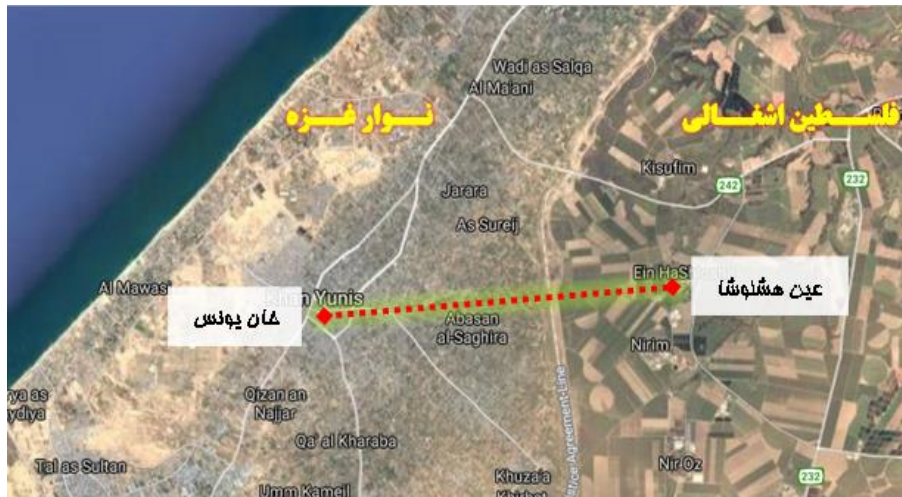
شکل ۲: تونل نظامی حماس میان خان یونس و عین هشلوشا

این تأسیسات مجهز نظامی علی‌رغم اینکه مبارزان حماس را قادر می‌ساخت در جواب تجاوزهای مسلحانه رژیم صهیونیستی وارد مناطق اشغالی این رژیم شوند و به انجام حملات غافلگیرانه علیه نظامیان این رژیم دست زنند، فرصت مناسبی را برای مصونیت و حفاظت در برابر حملات جنگنده‌های صهیونیست می‌داد تا در چنین مجموعه‌هایی پناه گیرند. اما نکته کاملاً مهم در این میان آن است که حتی به استناد رسانه‌های رژیم صهیونیستی، هیچ یک از حملات به پا خاسته از تونل‌های تدافعی حماس تاکنون نه منجر به آسیب غیرنظامیان شده است و نه مواضع و تأسیسات غیرنظامی از اینگونه حملات و سازه‌ها کوچک‌ترین آسیبی دیده‌اند. اطلاعات غیرطبقه‌بندی و منتشرشده از نحوه ساخت و کاربرد تونل‌های نظامی به وسیله نظامیان حماس گویای این مطلب است که آنان جز برای کسب مزیت نظامی، به سازه‌های زیرزمینی توسل نجستند و از این اسباب نه به عنوان یک سلاح، بلکه به عنوان یک روش جنگی بهره گرفته‌اند (Ginsburg, 2014). آنچه حماس را به استفاده از تونل در مواجهه با نظامیان صهیونیست بنا می‌داشت صرفاً اهداف مشروع دفاعی و اقتصادی بود که تا حدودی از فشارهای ضد حقوق بشری واردشده به مردم غزه بکاهد و در مقابل تجاوزگری‌های مسلحانه ارتش رژیم اشغالگر دست به دفاع مشروع بزنند.