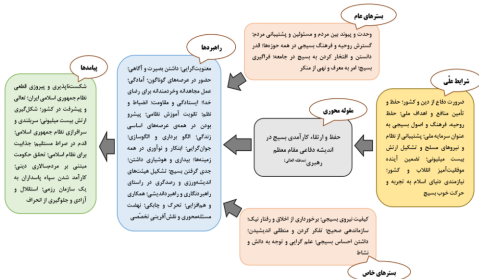
شکل ۲. الگوی حفظ و ارتقای کارآمدی بسیج در اندیشه دفاعی مقام معظم رهبری (مدظله العالی)