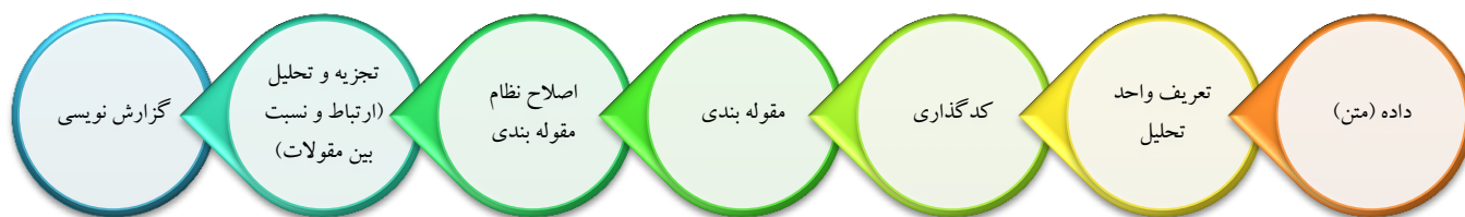
شکل ۱. فرایند تحلیل محتوای کیفی (مؤلف)