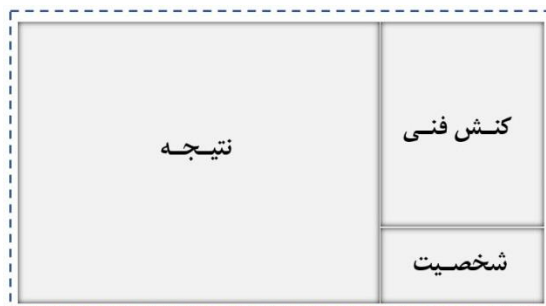
شکل ۱. نقشه مفهومی معنای عملکرد نزد یکی از مصاحبه‌شونده‌ها

همان‌طور که در این شکل قابل مشاهده است، نزد این مصاحبه‌شونده، مفهوم عملکرد بیشتر معنای نتیجه‌ای دارد. در پاسخ به بیشتر پرسش‌های مربوط به عملکرد، این مصاحبه‌شونده بیشتر بر معنای "عملکرد یعنی نتیجه" تأکید نموده است. حال آنکه او به معنای "عملکرد یعنی کنش فنی" و بعد از آن به "عملکرد یعنی شخصیت" نیز اشاراتی داشته است.