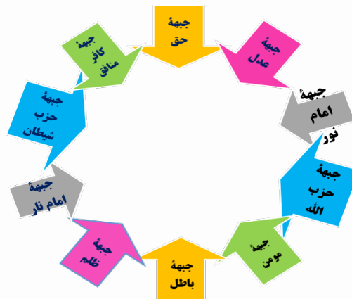
شکل شماره ۲: تقابل نمادهای دشمنی

خداوند متعال در آیات متعددی کافران را با خصوصیتی از قبیل تکذیب‌کنندگان پیامبر و آیات الهی، تکذیب‌کنندگان آخرت، متکبران و... نام برده است که آیه ذیل به‌عنوان نمونه ذکر شده است. (مَنْ كَانَ عَدُوًّا لِلَّهِ وَمَلَائِكَتِهِ وَرُسُلِهِ وَجِبْرِيلَ وَمِيكَالَ فَإِنَّ اللَّهَ عَدُوٌّ لِلْكَافِرِينَ)؛ کسی که دشمن خدا و فرشتگان و رسولان او و جبرئیل و میکائیل باشد (کافر است و) خداوند دشمن کافران است (آیه شریفه ۹۸، سوره مبارکه بقره).