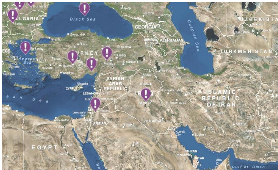
تصویر ۷: همکاریهای دفاعی و امنیتی ناتو در مناطق ژئوپلیتیکی غرب ایران (www.nato.int)