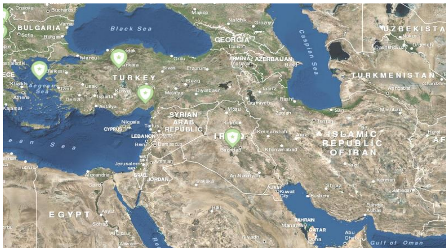
تصویر ۶: مأموریت‌های بشردوستانه ناتو در مناطق ژئوپلیتیکی غرب ایران، (www.nato.int)

یکی دیگر از راهبردهای ناتو برای فلمروسازی در سطح جهان و از جمله در مناطق ژئوپلیتیکی غرب ایران، مأموریت‌های به اصطلاح بشردوستانه این سازمان است. پایه و اساس ناتو در سال ۱۹۴۹م. انواع فعالیتها برای حفظ صلح و امنیت در منطقه یورواتلانتیک (مولایی و غلامی، ۱۳۹۳: ۳۴) بود که عملیاتهای مختلف، تمرینهای آموزشی در مقیاسهای مختلف، برنامه‌های آموزشی، حمایت‌های دفاعی هوایی، عملیاتهای شناسایی و گشت‌زنی، کمک به بلاای طبیعی و غیره نمونه‌هایی از این مأموریتها به‌شمار می‌آید. هر چند اولین مأموریت بشردوستانه عمده و رسمی ناتو در سال ۱۹۹۴م. و در جریان بحران بالکان و در بوسنی و هرزگوین رقم خورد، سرعت و تنوع مأموریت‌های بشردوستانه این سازمان افزایش چشمگیری داشته تا جایی که ناتو بسیاری از مأموریت‌های خود را به حوزه‌های تلاش برای حفظ صلح، آموزش و پشتیبانی لجستیکی و نظارت و کمک‌های بشردوستانه گسترش داده است (Børgensen, 2011) که تلاشی ملموس در جهت افزایش زمینه‌های فلمروسازی این سازمان در مناطق مختلف جهان به شمار می‌آید.