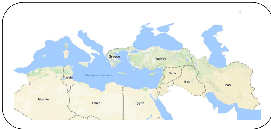
تصویر ۲: نقشه جغرافیای غربی نزدیک و دور ایران (نگارندگان)

برای مشخص شدن منطقه‌های ژئوپلیتیکی غرب ایران، اشاره به کلان منطقه ژئوپلیتیکی جنوب غرب آسیا ضروری است. جنوب غربی آسیا، که ایران نیز بخشی از آن به شمار می‌رود از چند منطقه ژئوپلیتیکی شکل گرفته است که این مناطق یا وجود دارد و یا بر مبنای ویژگی‌های درونی در حال تکوین به منطقه‌ای ژئوپلیتیکی است. یکی از منطقه‌بندی‌های شاخص در کلان منطقه جنوب غرب آسیا بر مبنای متغیر فرهنگی انجام پذیرفته است و این کلان منطقه را به سه منطقه تورانی، ایرانی و سامی تفکیک می‌کند (رومینا، ۱۳۹۲: ۷).