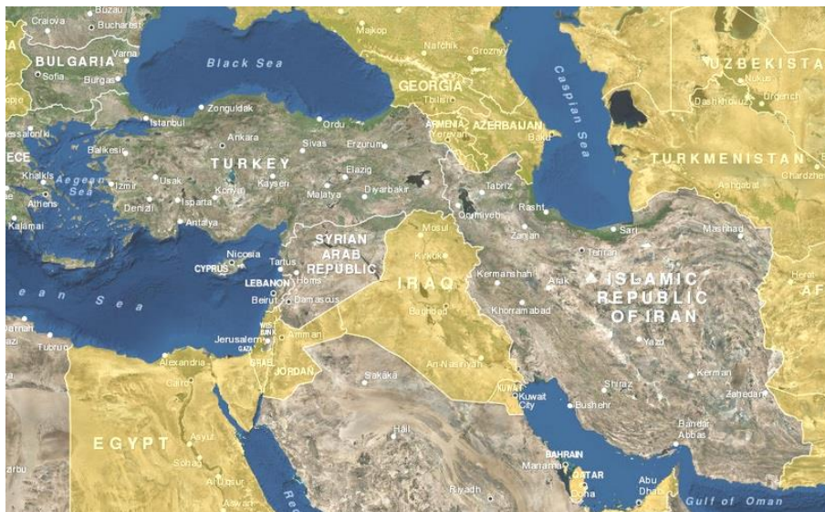
تصویر ۵: اعضای غیررسمی ناتو در مناطق ژئوپلیتیکی غرب ایران

از دیگر راهبردهای ناتو برای فلمروسازی، که در مناطق ژئوپلیتیکی غرب ایران نیز با قوت پیگیری می‌شود، گسترش مرزهای سیاسی غیررسمی سازمان است که ناتو آن را از طریق ابزار مشارکت و همکاری با تعدادی از کشورها دنبال می‌کند. در سوّمین مفهوم نوین امنیتی پیمان آمده است که ناتو برای ترویج امنیت و ثبات منطقه یورواتلانتیک با شبکه‌ای گسترده شامل بیش از ۴۰ کشور غیر عضو و سازمان بین‌المللی، که از مرکز و شرق اروپا تا صحرای غربی آسیا و اقیانوس آرام گسترده شده‌اند و درخواست عضویت در سازمان را دارند، مشارکت، و از آنها به‌عنوان «شریک» یاد می‌کند (بند ۱۲ مفهوم نوین امنیتی ناتو) (Stoltenberg, 19 May 2016). شراکت و همکاری مرحله‌ای مهم در فرایند تبدیل شدن کشورها به اعضای رسمی ناتو است.