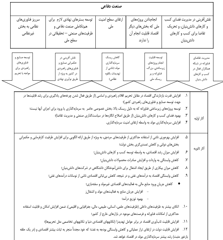
جدول ۳- الگوی تأثیر صنعت دفاعی بر اقتصاد ملی در گذار به اقتصاد مقاومتی

بعد از ارزیابی و اصلاح الگوی اولیه در کارگروه تخصصی گروه کانونی و تأیید اعتبار نتایج توسط اعضا، الگوی نهایی به صورت زیر استخراج شده است: