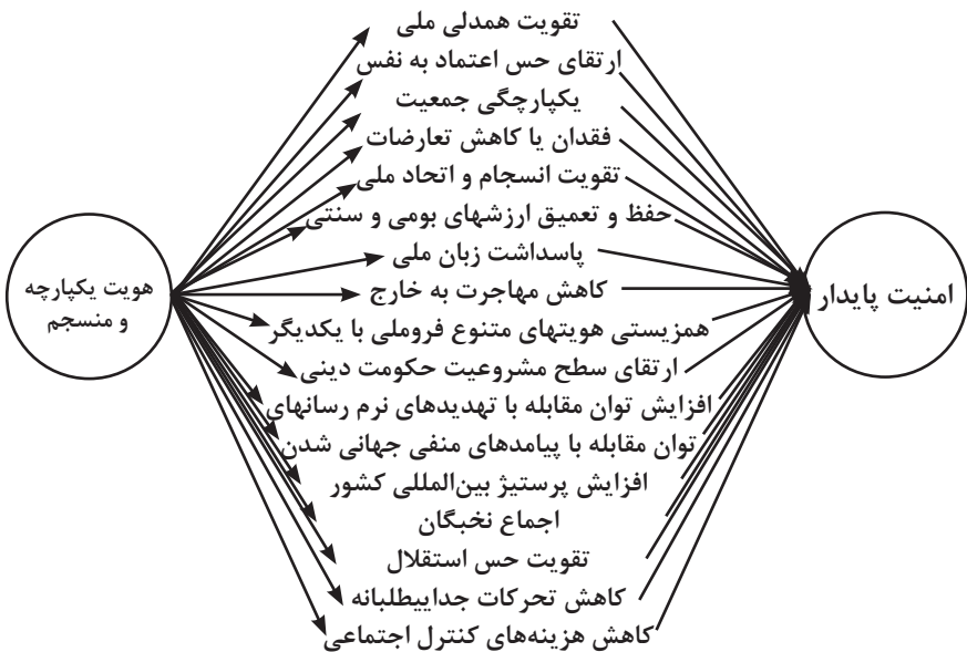
شکل ۲: چارچوب مفهومی رابطه هویت با امنیت ملی

از نگاه نخست می‌توان به تأثیر یا نقش هویت‌های جمعی در تولید امنیت پایدار نگریم. اکنون شایسته است رابطه دقیق‌تر میان حفظ هویت یکپارچه و منسجم در سطح ملی با امنیت ملی تبیین شود. در واقع اکنون دو مفهوم وجود دارد: اول، امنیت هویت به معنی حفظ هویت در مقابل خطرها و تهدیدها علیه آن؛ دوم، رابطه و تأثیری که هویت بر امنیت ملی می‌گذارد. در حالت دوم شماری از متغیرها و مفاهیم قابل بحث وجود دارند که در شکل‌دهی به کم و کیف رابطه هویت با امنیت تأثیرگذارند. برای تدقیق بیشتر به شکل زیر نگاه کنید: