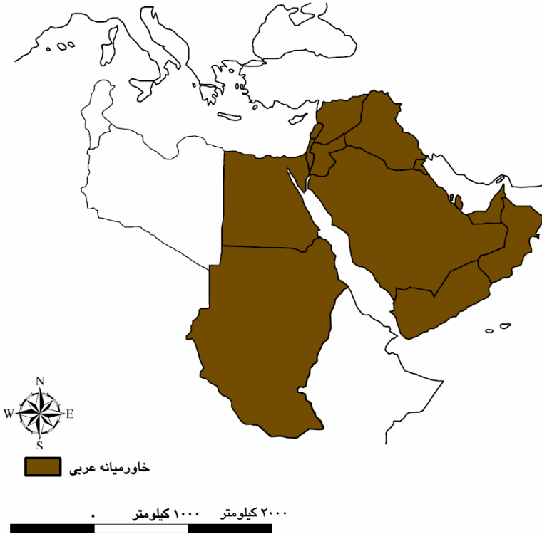
نقشه خاورمیانه عربی

۳. جایگاه خاورمیانه عربی در سیاست خارجی جمهوری اسلامی ایران عراق و کشورهای حوزه خلیج فارس به عنوان همسایگان عربی ایران، مصر بزرگ‌ترین و مهم‌ترین کشور عربی، سوریه مهم‌ترین متحد راهبردی ایران پس از انقلاب، عربستان مرکز حرمین شریفین و دارای جایگاهی ویژه بین کشورهای اسلامی و عربی، و فلسطین به عنوان مهم‌ترین محور سیاست خارجی ایران، در تدوین راهبردهای سیاست داخلی و خارجی ایران جایگاهی بی‌بدیل دارند. در واقع، خط‌مشی سیاسی ایران به عنوان یکی از بزرگ‌ترین و مهم‌ترین کشورهای اسلامی منطقه و دنیای اسلام، براساس اصول مدون در قانون اساسی کشور، تا حدود زیادی متأثر از منطقه است. مسئله فلسطین که محوری‌ترین و اساسی‌ترین اصل در سیاست خارجی جمهوری اسلامی ایران به شمار می‌رود، موضع ژئوپولیتیکی، علایق، اهداف و منافع ملی ایران را در قبال قدرت‌های منطقه‌ای و فرامنطقه‌ای