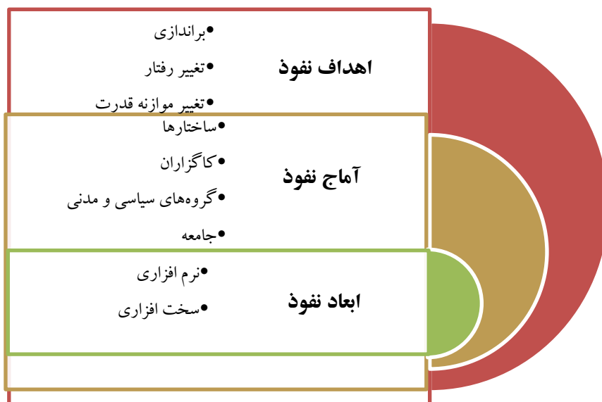
تصویر-۳. چارچوب مفهومی پژوهش