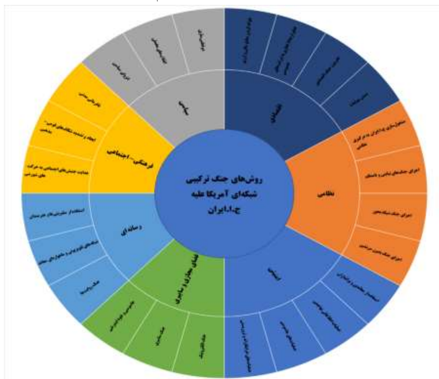
شکل شماره ۳: روش‌های جنگ ترکیبی شبکه‌ای آمریکا علیه ج.ا.ایران

جهت منزوی ساختن ایران و... مؤید آن است که روش تهدیدات امنیتی ایران به سمت ترکیبی شبکه‌ای پیش رفته است. بر اساس یافته‌های تحقیق در جدول شماره ۲ تعداد ۲۴ روش برای اجرای جنگ ترکیبی شبکه‌ای آمریکا علیه ج.ا.ایران در ۷ مؤلفه به ترتیب اولویت عبارت‌اند از: رسانه‌ای ۳ روش، امنیتی ۴ روش، اقتصادی ۴ روش، فرهنگی-اجتماعی ۳ روش، فضای مجازی و سایبری ۳ روش، نظامی ۴ روش و سیاسی ۳ روش است. روش رسانه‌ای در حد خوب مؤثر است، روش سیاسی در حد کم و روش‌های امنیتی-اقتصادی، فرهنگی-اجتماعی، فضای مجازی و سایبری و نظامی در حد متوسط در شکل‌گیری جنگ هیبریدی شبکه‌ای آمریکا علیه ج.ا.ایران مؤثر هستند. شایان ذکر است که برخی از روش‌هایی که در شکل زیر بیان شده است در شکل قبلی به‌عنوان عوامل شکل‌گیری در جنگ ترکیبی شبکه‌ای بیان شده است، به عبارتی دیگر برخی از عوامل جنگ ترکیبی شبکه‌ای همزمان به‌عنوان روش جنگ ترکیبی هم استفاده شده است.