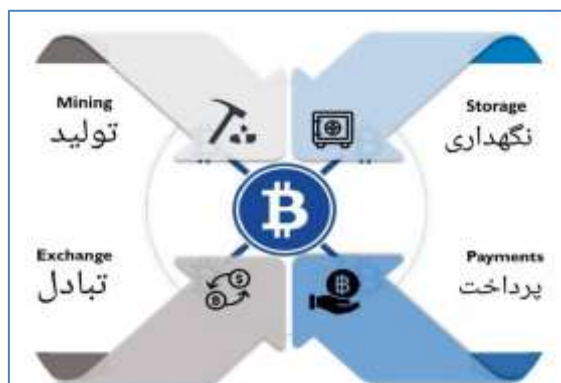
شکل ۲: زیست بوم و حالت‌های مختلف برای رمزارزش‌ها (Rauchs et al, 2019: 19).

همچنین اکنون می‌توان کلیه بازیگران اکوسیستم و زیست بوم رمزارزش‌ها را بشرح جدول ذیل نسبت به هر حوزه تقسیم نمود ۱ :