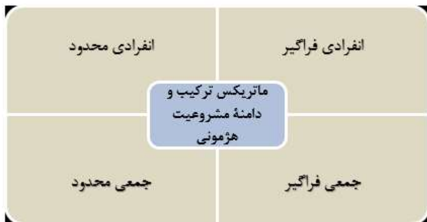
شکل ۳. اشکال چهارگانه هژمونی هوشمند (کلارک، ۲۰۱۱: ۶۱)

Source: Clark, I. (2011). Hegemony in international society . Oxford University Press.