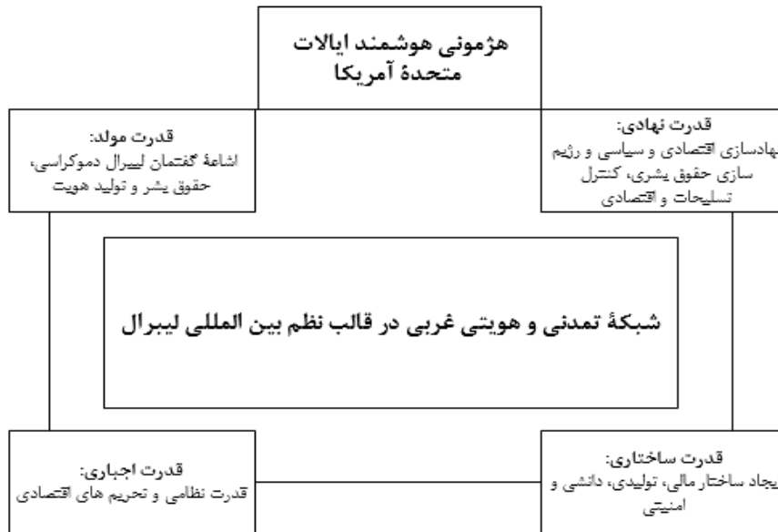
شکل ۴. هژمونی هوشمند آمریکا و نظم لیبرالی (آسیابان، ۱۴۰۱: ۱۵۹)